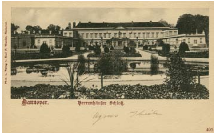
Abbildung des alten Herrenhäuser Schlosses

ein lahmes Pferd erworben.“ Schließlich musste die Stadt auch noch feststellen, dass für die Verbindung der beiden Museumsflügel ein unterirdischer Verbindungsgang notwendig ist, weil der Mittelteil des Schlosses meist von Veranstaltungen