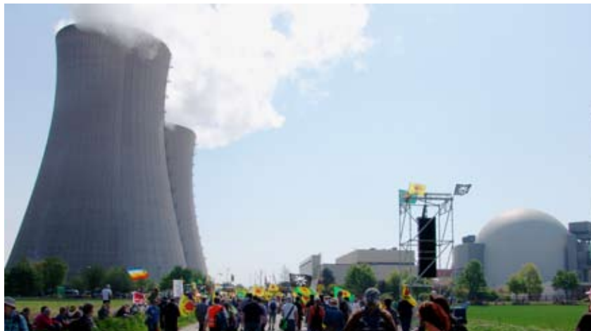
Protest gegen das AKW Grohnde am Ostermontag.

Das AKW ging 1986 ans Netz. Es handelt sich um einen 1.200 Megawatt Druckwasserreaktor, der etwas weniger störfallanfällig ist als Siedewasserreaktoren der Marke Fukushima. Auch wenn bei den deutschen Reaktoren wegen ihrer zahlreichen Störfälle insbesondere die Atommeiler in Bruns-