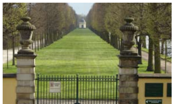
Da das neue Schloss den Haupteingang versperrt, sollen die Gäste durch die alten Nebeneingänge eingelassen werden.

der VW-Stiftung belegt ist. Die dafür notwendigen 1,25 Millionen Euro spendet jetzt der Verband der Niedersächsischen Metallarbeitgeber. Dazu Oliver Förste: „Die Sponsoring-Tätigkeit des Metall-Arbeitgeberverbandes halte ich für äußerst problematisch. Die Städte und Landkreise haben immer weniger Geld für kulturelle und historische Aufgaben zur Verfügung. Wenn private Sponsoren einspringen, werden die Kommunen abhängig von diesen ‚guten Gaben‘, und dann bestimmen wenige reiche Geldgeber, was in der Stadt passiert.“ Überhaupt wendet sich die Linksfraktion im Rat gegen eine Symbolik der „Geschichte von oben“, wie sie mit einem feudalen Adelsschloss wieder hergestellt werden soll.