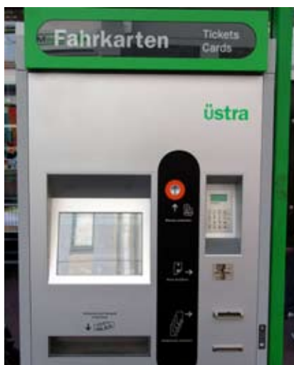
Hier wird abkassiert

ste stets über den Planungen lagen. Dem Argument, dass mit den Fahrpreissteigerungen Lohnerhöhungen finanziert werden müssten, widerspricht die Linksfraktion. Die Einkommenszuwächse für die Beschäftigten fallen dieses Jahr nur rund halb so hoch wie die Fahrpreissteigerungen aus. Außerdem haben die Verkehrsunternehmen in den vergangenen Jahren die Zahl der Beschäftigten verringert, und neu eingestellte MitarbeiterInnen erhalten teilweise rund ein Viertel weniger Gehalt als früher.