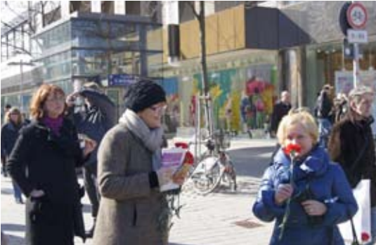
Reißender Absatz - Nelken auf dem Weltfrauentag

Auch in diesem Jahr hat DIE LINKE mit unterschiedlichen Aktionen und Veranstaltungen an das 100-jährige Jubiläum des internationalen Frauentages erinnert. Zur Tradition im Herzen Hannovers hat sich das jährliche Verteilen