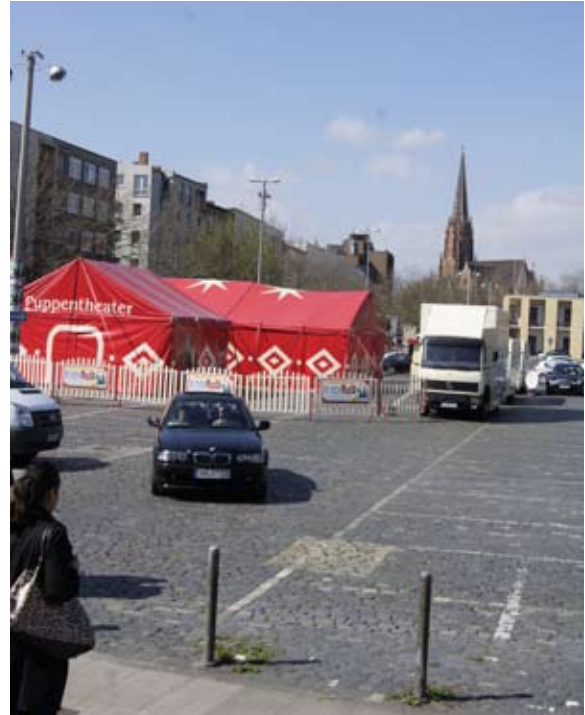
Nicht nur als Aufmarschgebiet interessant, sondern auch als vielfältiger Veranstaltungsort.