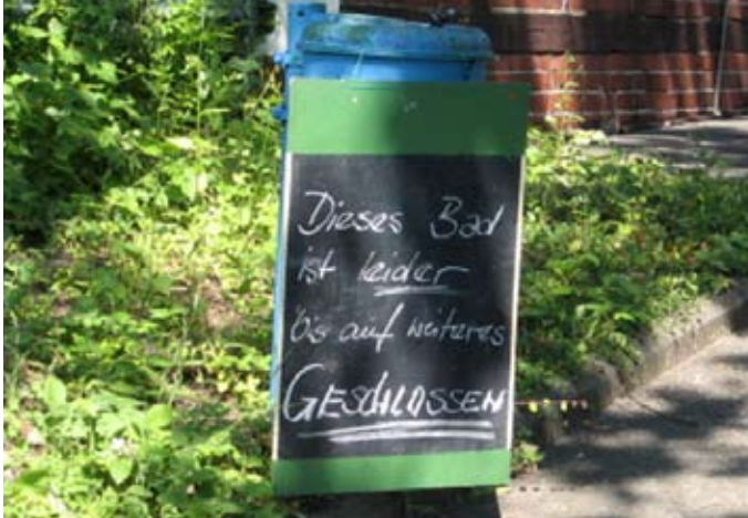
Bittere Realität und zugleich beredtes Zeichen des Scheiterns - das Hainholzer Bad im Sommer 2010

Die Stadt betreibt derzeit das Naturbad in Hainholz. Das war nicht immer so. Noch im Sommer vergangenen Jahres hatte das Bad bei bestem Sommerwetter geschlossen. Grund für die Schließung zur Badesaison war eine vom Gesundheitsamt festgestellte Verunreinigung mit gefährlichen Bakterien. Der damalige Betreiber, eine Unternehmungsgesellschaft aus Bezirksratsmitgliedern von SPD und CDU, musste deshalb