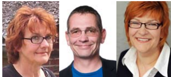
Neue Linksfraktion im Rat (von links):